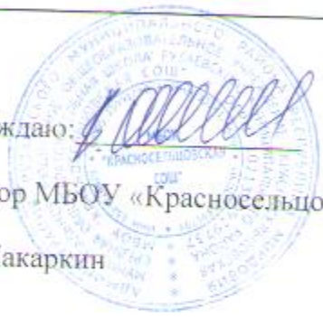
График проведения родительского контроля за организацией горячего питания в МБОУ «Красносельцовская СОШ» Рузаевского муниципального района на 2023-2024 учебный год.